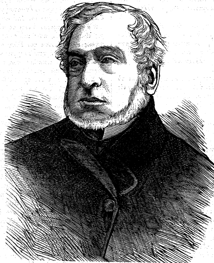
Ο βαρῶνος ΡΟΘΣΙΔΑ

Ἐν τῷ αὐτῷ τόπῳ ἔζη πλούσιος κύριος, ἀγαθὸς μὲν ἀλλὰ ἐκδοτος εἰς ἀστεϊότητα. Ἡμέραν τινα ἐπρότεινε εἰς τινὰς φίλους νὰ πορευθῶσι μετ' αὐτοῦ εἰς τὸν ἅγιον Δερβίσην πρὸς ἐπίσκεψιν. «Ἐπιθυμῶ», εἶπεν ὁ κύριος, «νὰ τῷ ὑποβάλω τρία ζήτήματα εἰς τὰ ὁποῖα ποτὲ δὲν θὰ δυνηθῆ νὰ ἀπαντήσῃ». Εὗρον